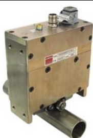
Snímač pro trubky