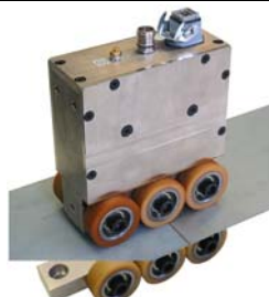
Snímač pro plechy se spodním přitlakem