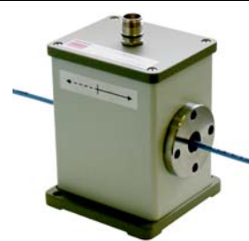
Snímač pro dráty

Mimo zde uvedené nejběžnější snímače jsou dostupné i další typy.